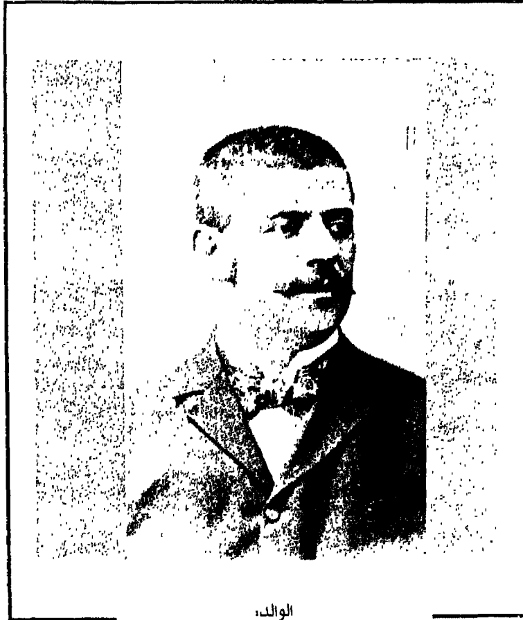
الوالد، هرمان كافكا (في نحو عام ١٨٨٢)